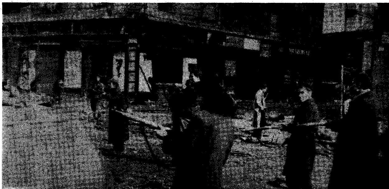
Hongrie 1956 — les ouvriers luttèrent contre la bureaucratie stalinienne, pour la démocratie des conseils ouvriers et la défense des acquis prolétariens

La tradition révolutionnaire de solidarité des classes ouvrières polonaise et soviétique, représentée par Rosa Luxemburg, est cruciale pour forger le trotskysme polonais. Une révolution politique prolétarienne en Pologne doit se propager à l'URSS et au reste du bloc soviétique sous peine d'être écrasée. Mais les ouvriers polonais ne peuvent s'adresser à leurs frères de classe soviétiques, qui ont eu 20 millions de tués (dont 600.000 en Pologne) en combattant