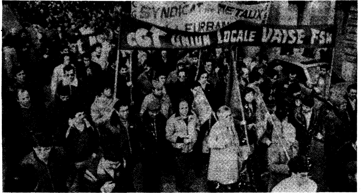
Lyon, le 24 février — Manifestation contre l'évacuation de l'usine Leleu par la police. Les bureaucrates n'organisent pas la riposte nécessaire aux attaques des flics et des milices patronales

De plus, ils n'ont pas eu la moindre action — ni même le moindre témoignage — de solidarité avec nos frères de classe américains victimes d'un patron français. Et ce patron s'appelle Renault, l'entreprise nationalisée tant vantée par les eurostaliniens. Renault, qui vient de prendre le contrôle de American Motors Corp, défend les profits français en cherchant à se servir des concessions que les géants américains de l'automobile ont obtenues des bureaucrates trafres qui dirigent le syndicat américain de l'automobile (l'UAW): blocage des salaires, suppression d'une partie des congés payés (déjà bien limités) et de primes, soi-disant en échange d'une "garantie de l'emploi" qui se traduira dans les faits par davantage de licenciements! Ce n'est pas "seulement" une violente attaque contre les conditions de vie et de travail des ouvriers, c'est une remise en cause des acquis ouvriers arrachés par des dizaines d'années de lutte, c'est l'avenir du syndicat qui est en jeu. Un des "remèdes" classiques des chauvins du PCF à la crise économique, c'est "Investissons français", mais voilà une "multinationale" qu'ils soutiennent! Ni les bureaucrates de la CGT ni ceux de l'UAW ne sont capables ni de mener ni de coordonner des grèves et autres actions contre leur patron commun.