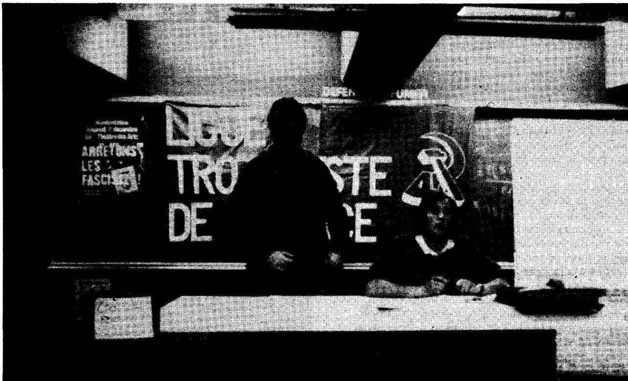
Meeting Pologne. Par peur de débattre avec les trotskystes, l'UEC laissera vide la chaise que lui offrait la LTF